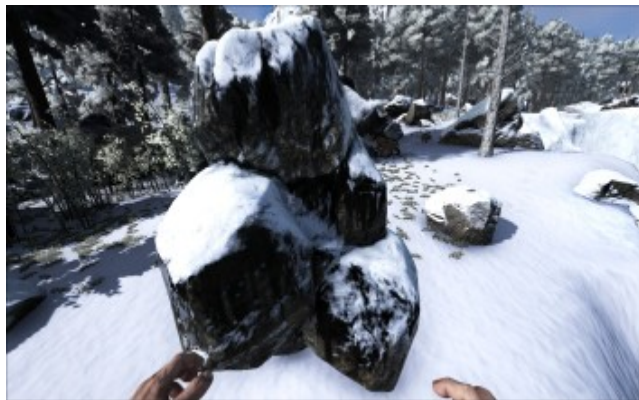
Ölvorkommen an Land (Norden)