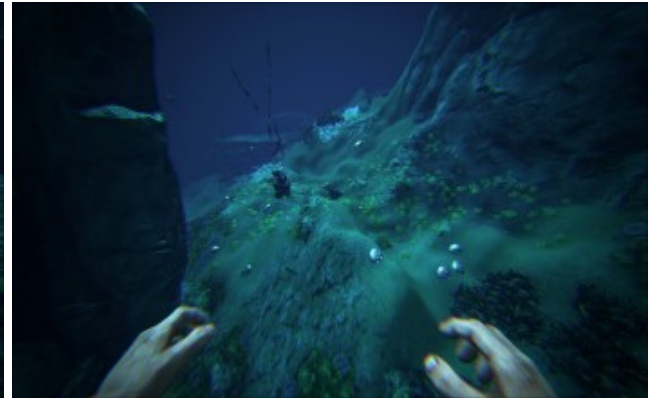
Ölvorkommen im Ozean