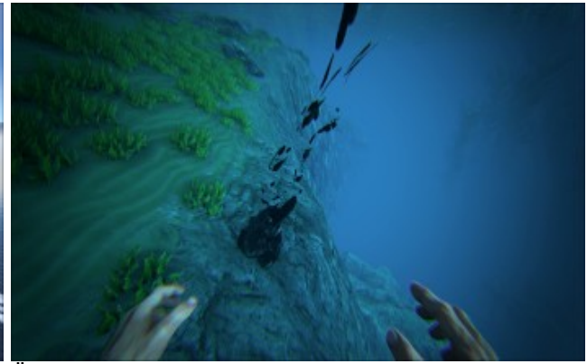
Ölvorkommen im Ozean