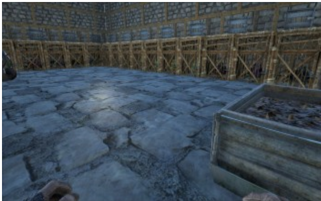
Dung Beetle im Holzkäfig bei der Ölproduktion.