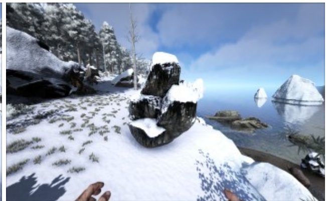
Ölvorkommen an Land (Norden)