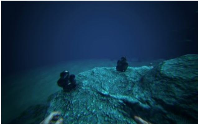
Ölvorkommen im Ozean