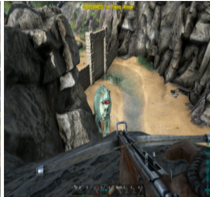
Giganotosaurus aus sicherer Höhe betäuben.