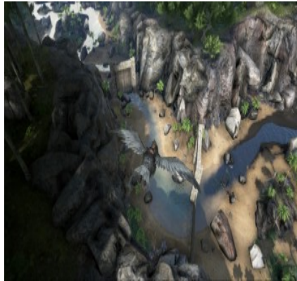
(Gehege für den Giganotosaurus am Smugglers Pass)