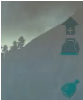
Anzeige des Wut - Modus

Weiterhin besitzt der Giganotosaurus eine Rage - Modus (Wut Modus), dieser wird ausgelöst sobald er ein gewisses Maß an Gesundheitlichen Schaden hat. Dies kann z.B. passieren, wenn Ihr mit ihm einen Abhang herunter springt, der Giganotosaurus wird Euch abwerfen und einfach auffressen. (Dem entgegen wirkend könnt Ihr während der Giganoto mit Euch im Sattel fällt, einfach absteigen, der Giganoto wird dann beim aufkommen keinen schaden nehmen und demzufolge auch nicht aggressiv werden.) Andererseits wird der Wut Modus auch in kämpfen aktiv, dies äußert sich in einem weitaus größeren Schaden, welchen der dabei Giganoto austeilt. Ob ein Giganoto im Wut Modus ist erkennt Ihr an seinen orangen Augen und an dem roten Gebiss in der rechten oberen Ecke, der Wut Modus hält für 5 Sekunden vor und wird neben der Gesundheitsanzeige, sehr zügig während eines Kampfes, aufgeladen.