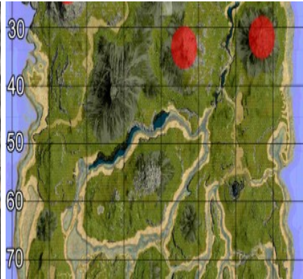
Häufige Spawnpunkte des Giganotosaurus.