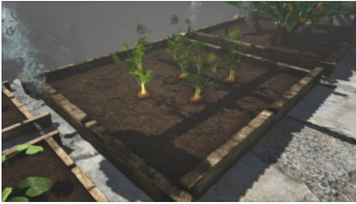
großes Beet mit Karotten