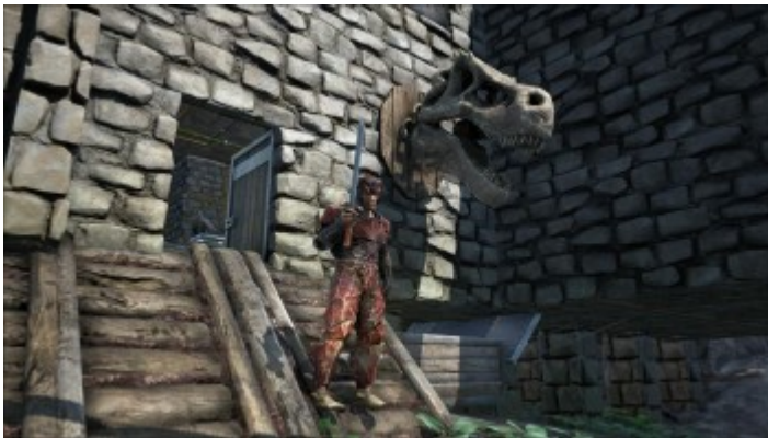
ein ARK Avatar mit seinem Schwert