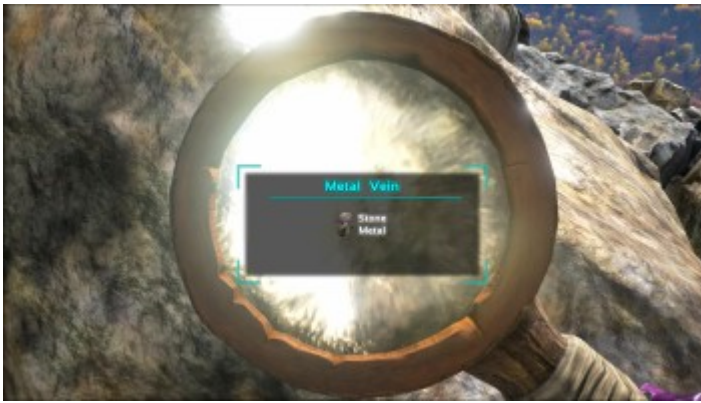
Metallhaltiges Gestein durch die Lupe betrachtet.