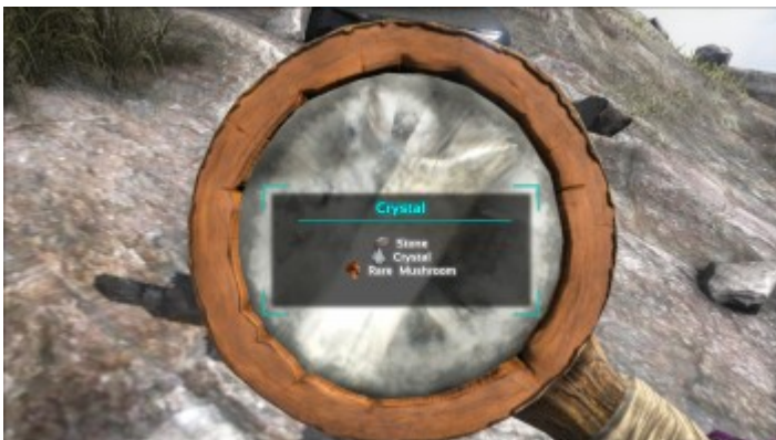
Kristall durch die Lupe betrachtet.