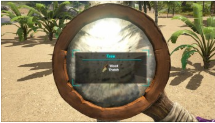
Ein Baum durch die Lupe betrachtet.