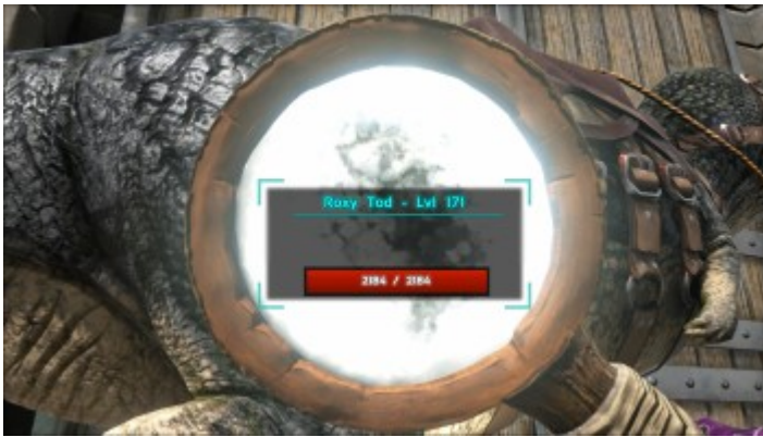
Ein Dino durch die Lupe betrachtet.