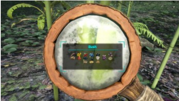
Ein Strauch durch die Lupe betrachtet.