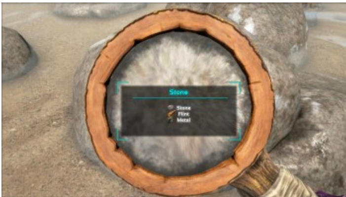
Ein Stein durch die Lupe betrachtet.