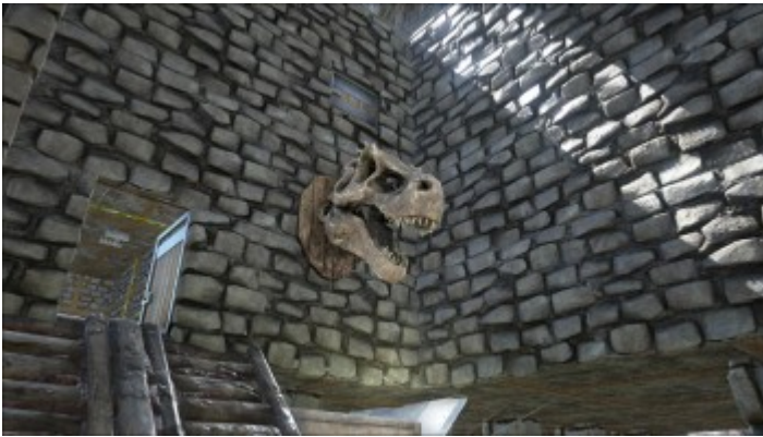
Trophäenwandhalterung mit Alpha Rex Trophäe