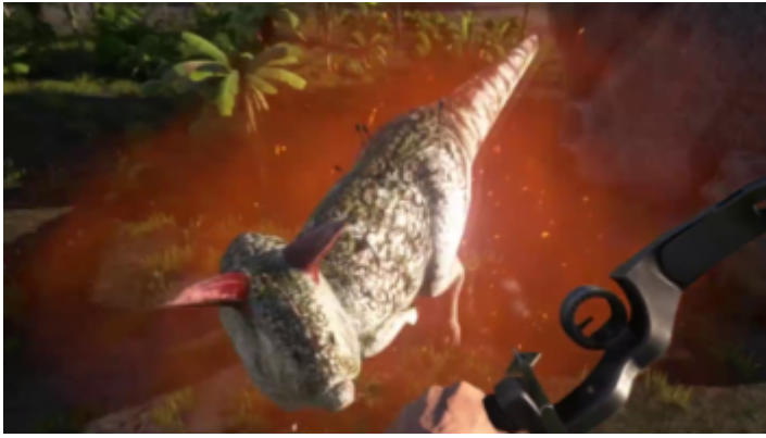
Ein Alpha Carnotaurus in freier Wildbahn