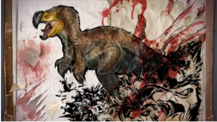
Die blutverschmierte Notiz, ohne Inhalt...