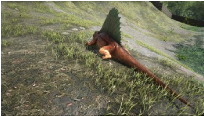
Ansicht von hinten