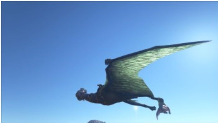
Dimetrodon hängt am Quetzal