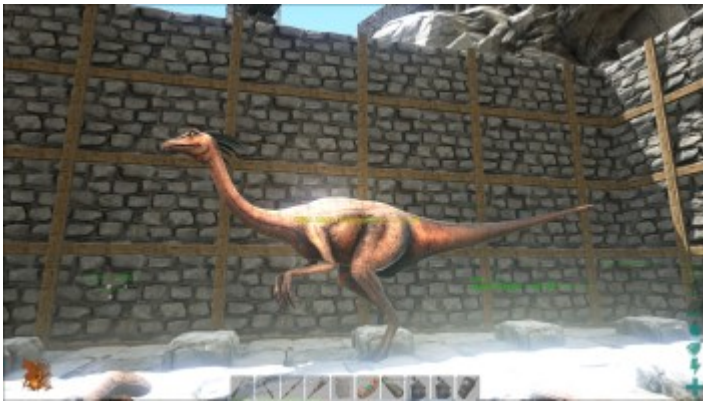
Ein frisch gefangener Gallimimus in der Tamingarena.