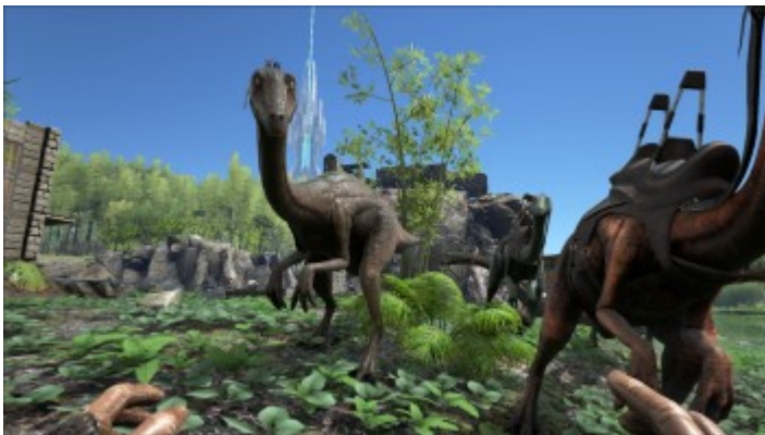
Der Gallimimus von Vorn.