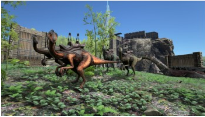
Gallimimus mit Gallimimus Sattel .