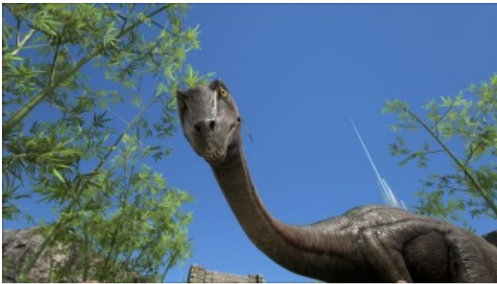
So guckt der Gallimimus.