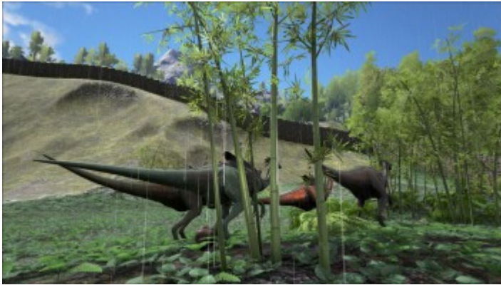
So sieht die Kehrseite des Gallimimus aus.