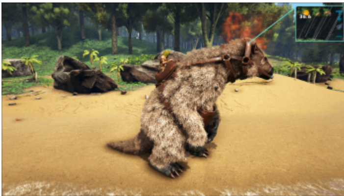
Ein Megatherium mit aktiven Insekten Instinkt.

Gegen Insekten ist dieser Buff sogar noch größer, dabei wird der Schaden mit 375% multipliziert so erhält man unglaubliche Mengen an Chitin .