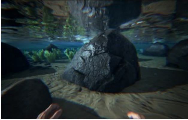
Schwarze Flusssteine, daraus gewinnt man etwas mehr Metall .