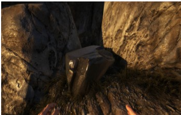
Obsidian , optimal für den Doedicurus um Metall zu farmen.