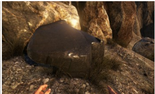
Obsidian , optimal für den Doedicurus um Metall zu farmen.