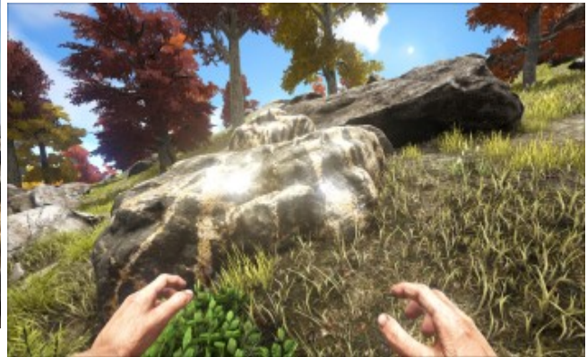
Kleines Metallvorkommen am Berghang.