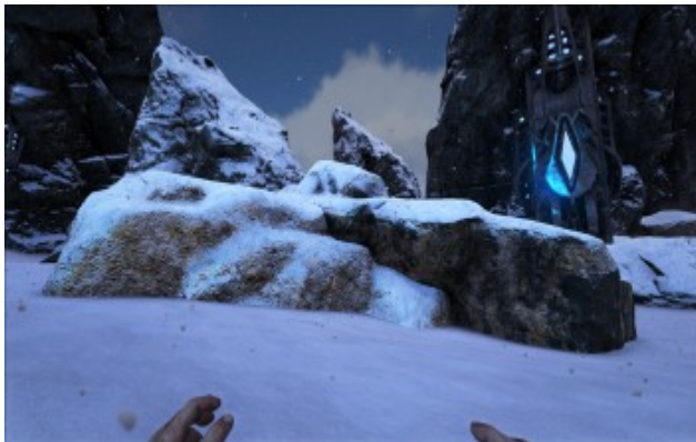
Metallvorkommen in Schnee biome.