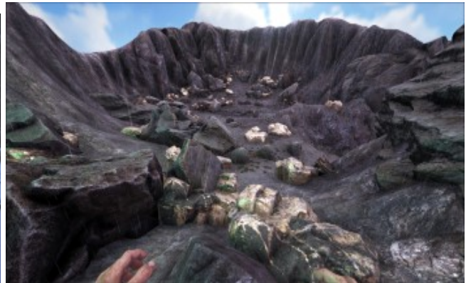
Metallvorkommen im Vulkan, ein Eldorado für den Ankylosaurus .