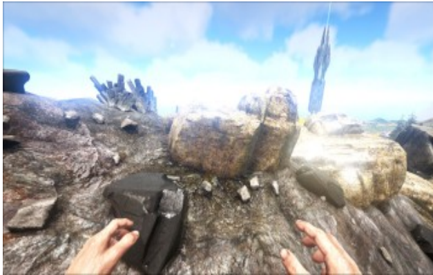
Großes Metallvorkommen auf einem Berg, mit Obsidian (Vordergrund, schwarz ) und Kristall (Hintergrund, links).