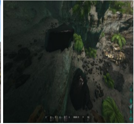
Obsidian in einer Höhle