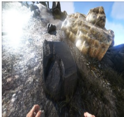
Obsidian am Berghang