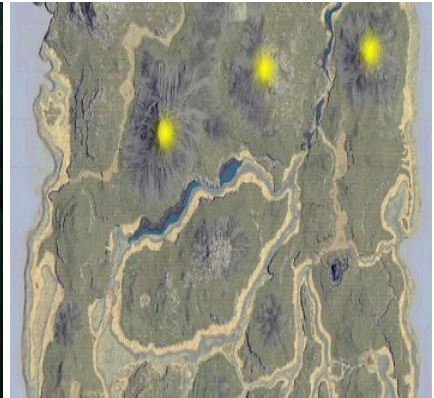
Obsidian in einer Höhle