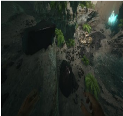
Obsidian in einer Höhle