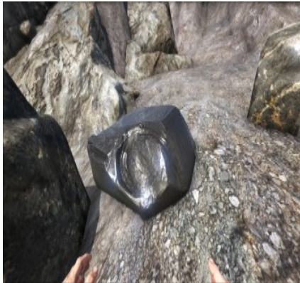
Obsidian am Berghang