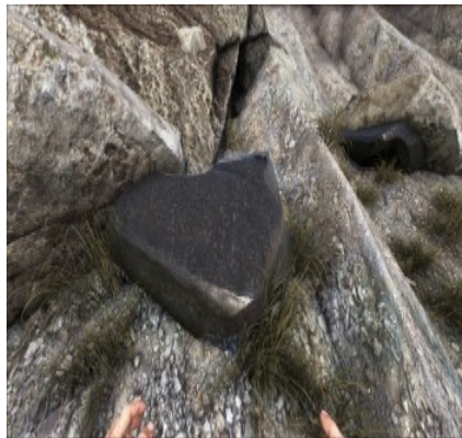
Obsidian am Berghang