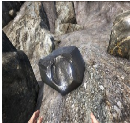
Obsidian am Berghang