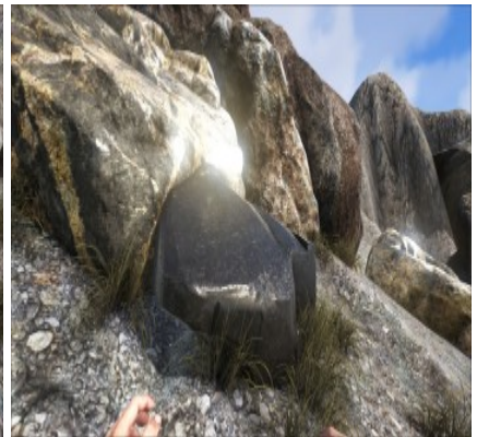
Obsidian am Berghang