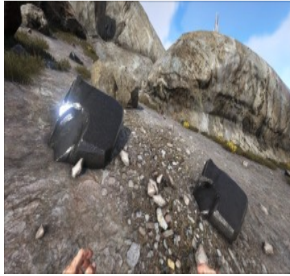
Obsidian am Berghang