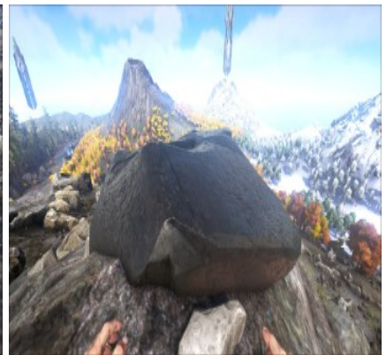
Obsidian am Berghang