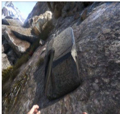
Obsidian am Berghang