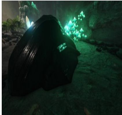
Obsidian in einer Höhle