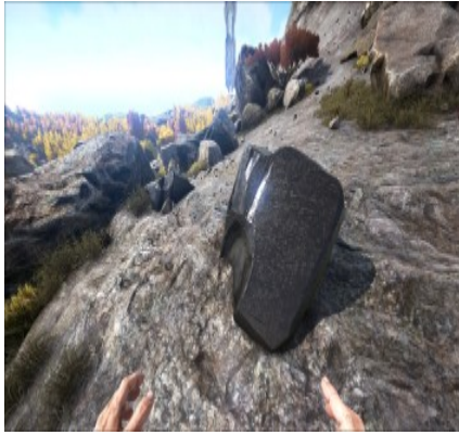
Obsidian am Berghang