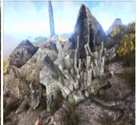
Kristallvorkommen an verschiedenen Bergen.