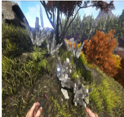
Kristallvorkommen an verschiedenen Bergen.