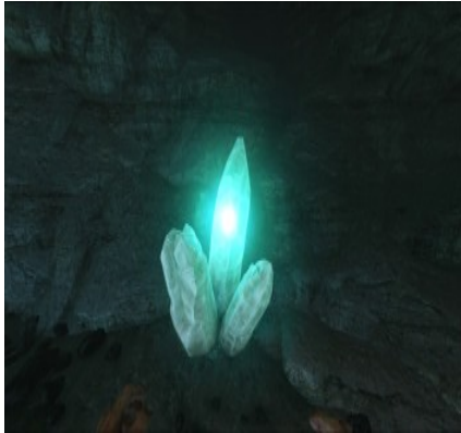
Kristallvorkommen in verschiedenen Höhlen.