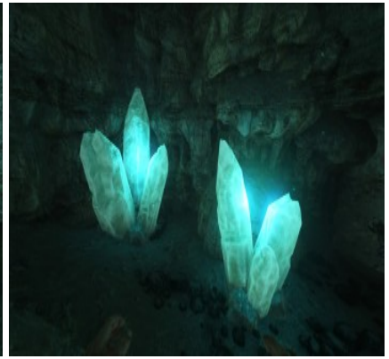
Kristallvorkommen in verschiedenen Höhlen.