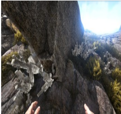
Kristallvorkommen an verschiedenen Bergen.