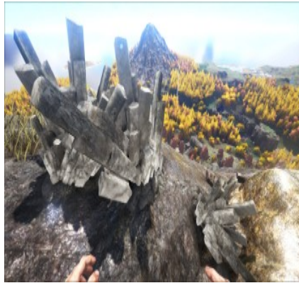
Kristallvorkommen an verschiedenen Bergen.