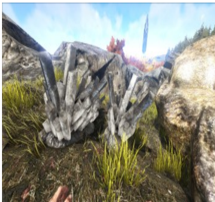
Kristallvorkommen an verschiedenen Bergen.