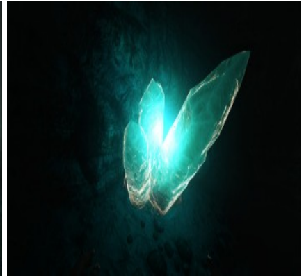
Kristallvorkommen in verschiedenen Höhlen.