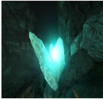
Kristallvorkommen in verschiedenen Höhlen.