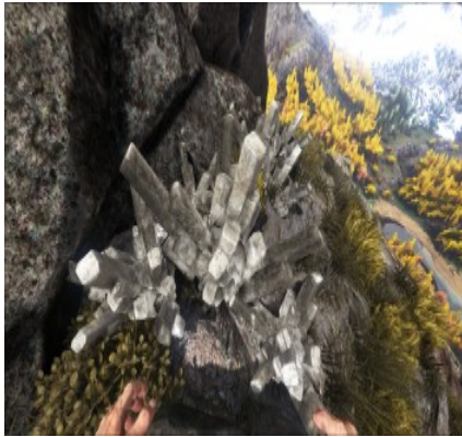
Kristallvorkommen an verschiedenen Bergen.