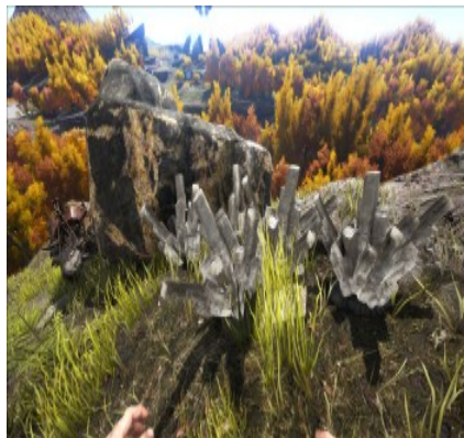
Kristallvorkommen an verschiedenen Bergen.