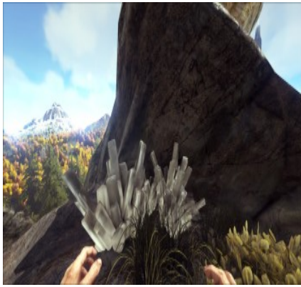
Kristallvorkommen an verschiedenen Bergen.