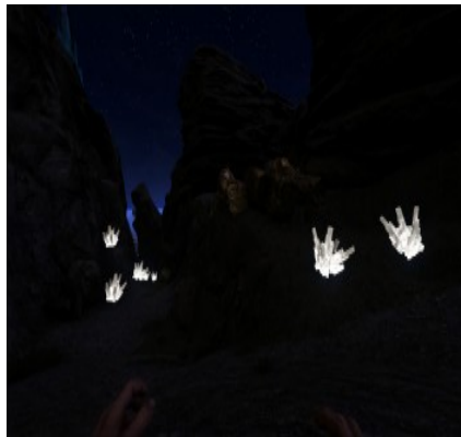
Kristallvorkommen sind bei Nacht weithin sichtbar.