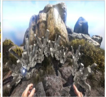
Kristallvorkommen an verschiedenen Bergen.