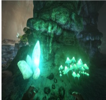
Kristallvorkommen in verschiedenen Höhlen.