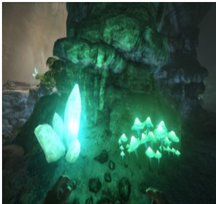
Kristallvorkommen in verschiedenen Höhlen.