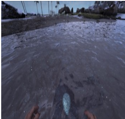
Siliziumperlen am Nordstrand 15/41