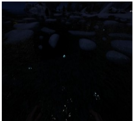
Siliziumperlen am Weststrand 35/17.4 (Bei Nacht, Siliziumperlen leuchten, so kann man sie gut ausmachen.)