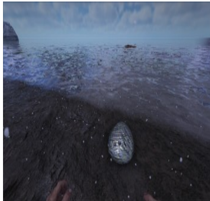
Siliziumperlen am Nordstrand 15/41