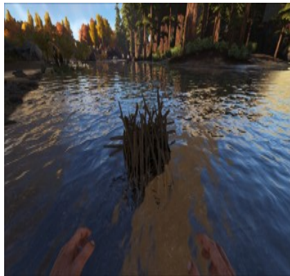
Ein Biberdamm , auch eine gute Möglichkeit Siliziumperlen zu finden.