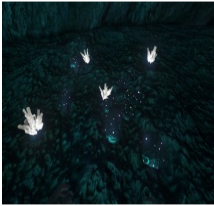
Siliziumperlen in einer Unterwasserhöhle