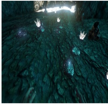
Siliziumperlen in einer Unterwasserhöhle