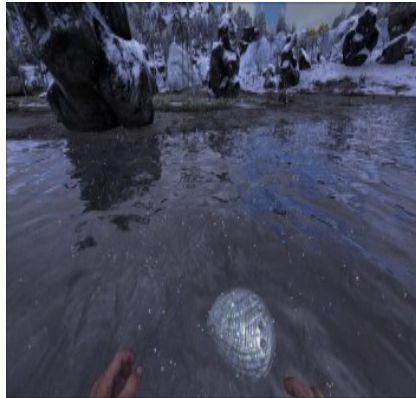
Siliziumperlen am Nordstrand 15/41