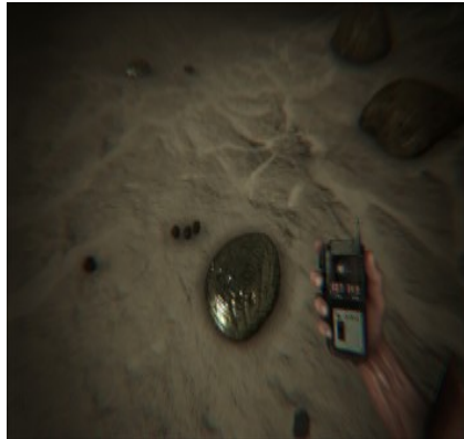
Siliziumperlen im Flussbett 30/34