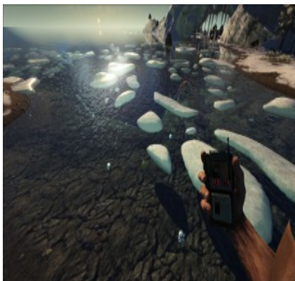
Siliziumperlen am Weststrand 35/17.4