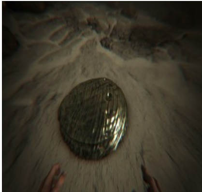
Siliziumperlen im Flussbett 30/34