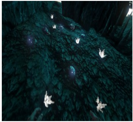
Siliziumperlen in einer Unterwasserhöhle