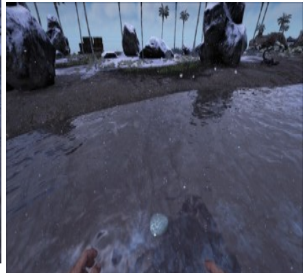
Siliziumperlen am Nordstrand 15/41