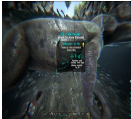
"Take Oxygen" Option direkt am Tier.