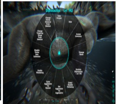
Die "ride" Option auf 1 Uhr.