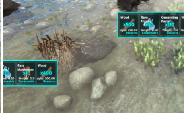
Biberdamm mit seinen Ressourcen.