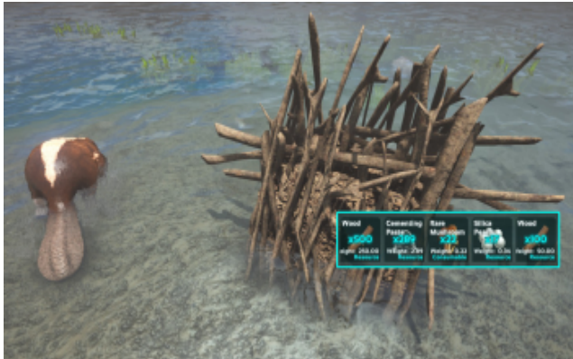
Biberdamm mit seinen Ressourcen.