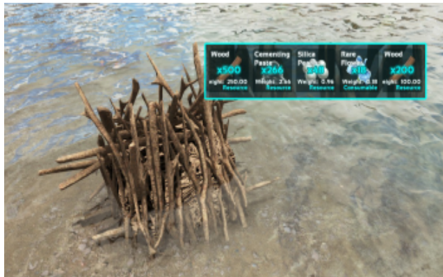
Biberdamm mit seinen Ressourcen.