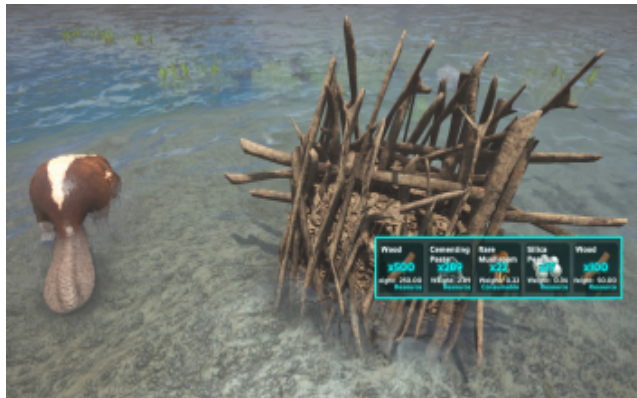
Biberdamm mit seinen Ressourcen.