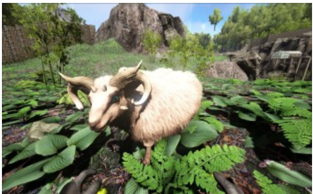
Rohes Hammelfleisch gibt es von einem Schaf