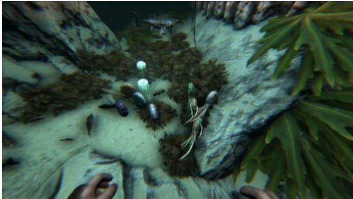
Ammoniten in einer Unterwasserhöhle.

Fundort: Tiefer Ozean / Unterwasserhöhlen